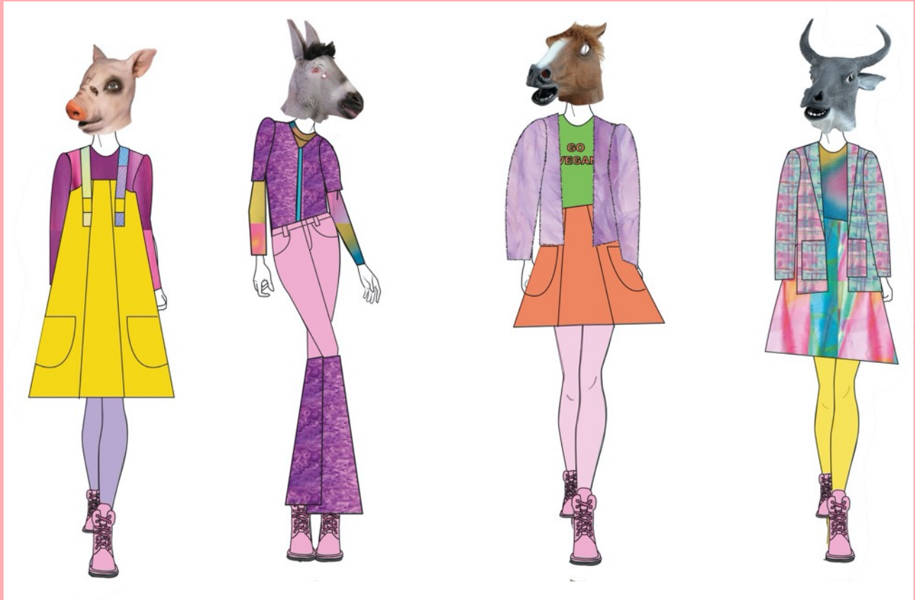
Line up, skiss av hela kollektionen