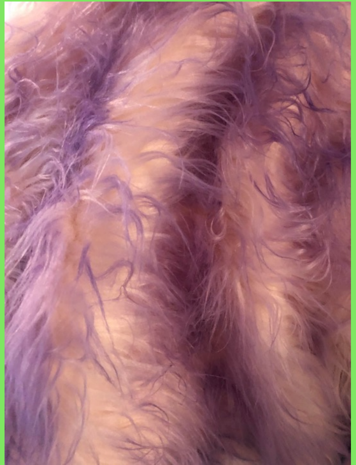
Fejrpäls där jag färgat topparna.