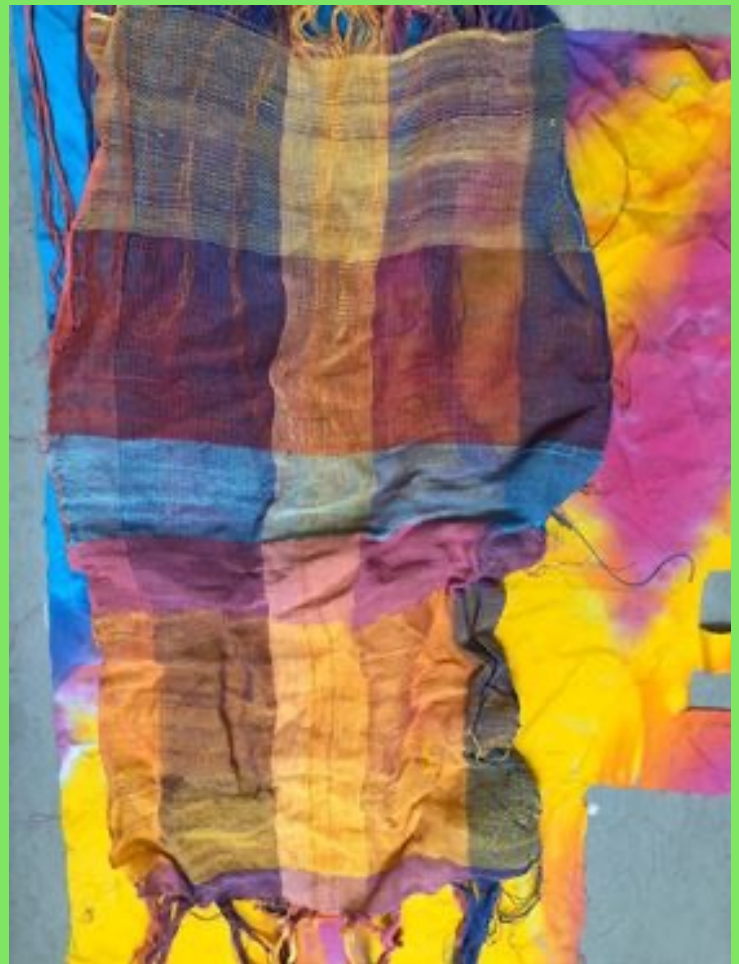
Handvävt tyg i bomull och lin. Handmålade tyg i ekologisk bomull. Material till en väska.