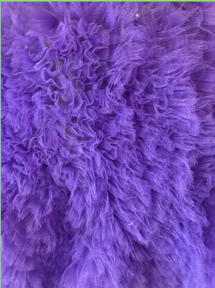
Tyll manipulerad att se ut som päls på håll.