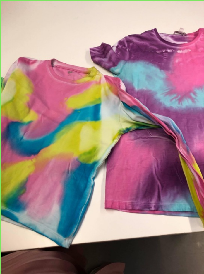
Handmålade tröjor inköpta second hand.