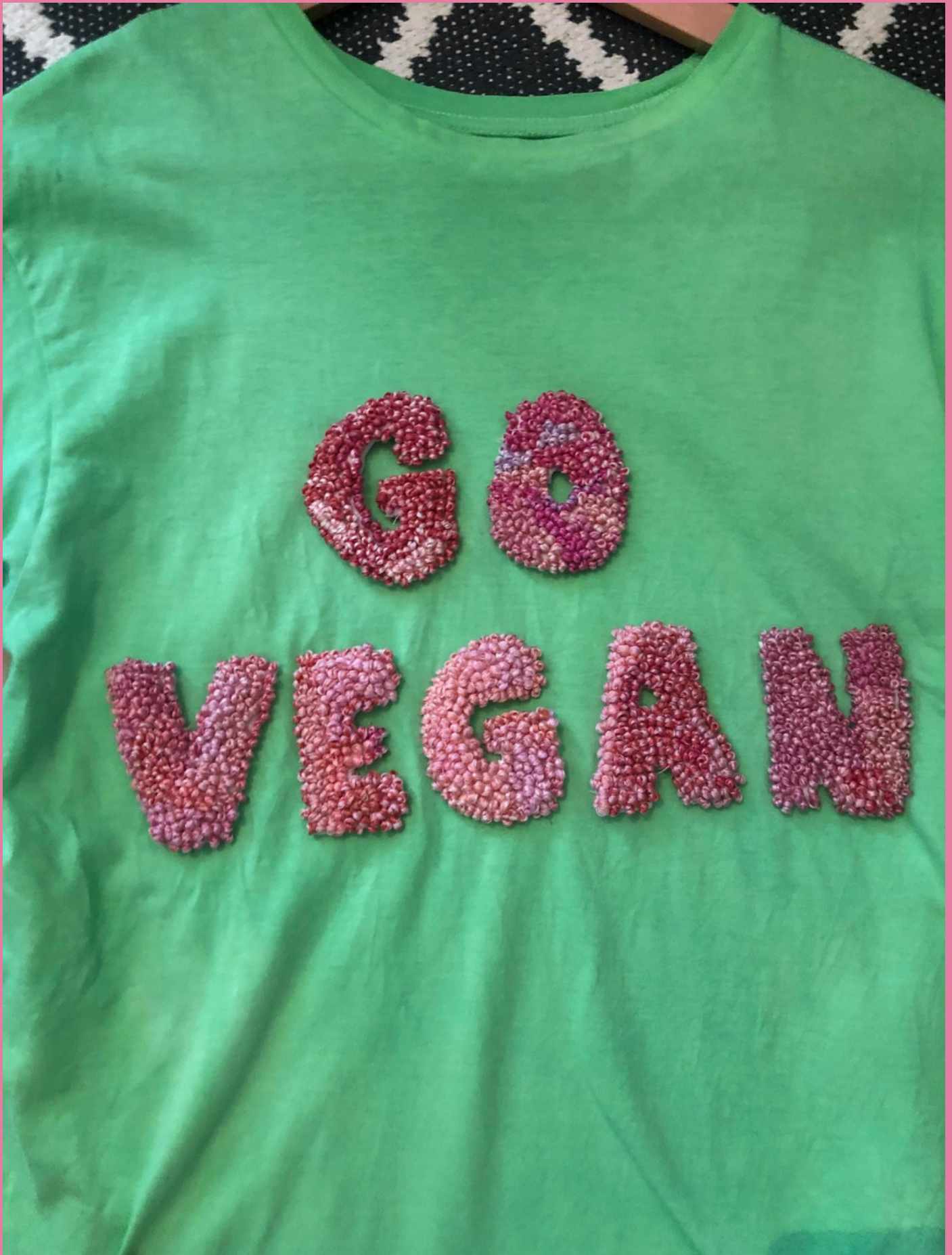
Handbroderade franska knutar på en handfärgad t-shirt. Både broderitråd och t-shirt är i 100 % bomull och inköpta second hand.