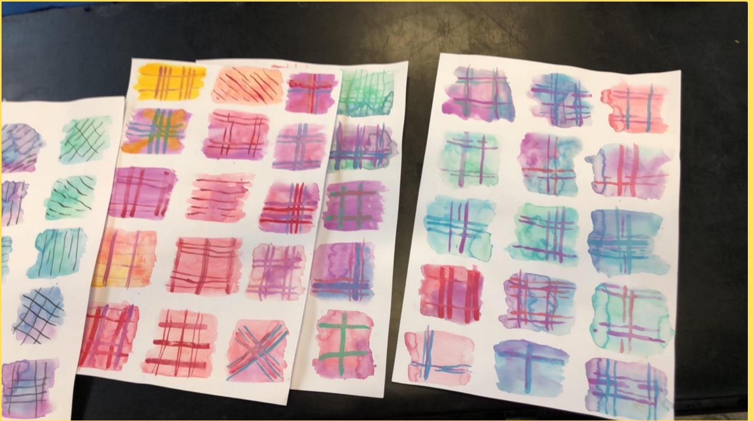
Skisser på det skeva rutmönstret.