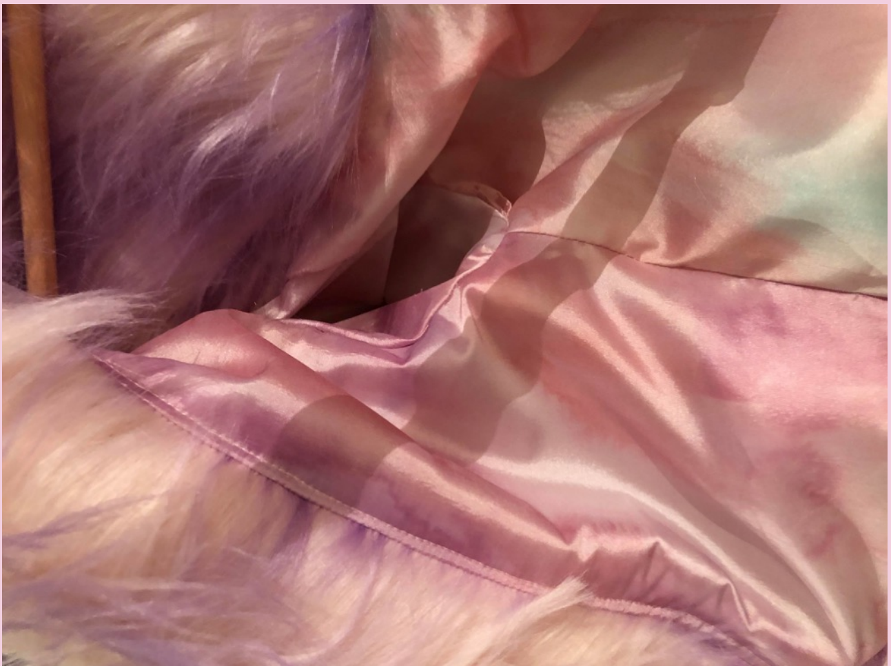
Transfertryckt fodertyg med akvarellskisser som förlaga. Pälsen är airbrushad för att få in ett mer unikt, säregt uttryck.