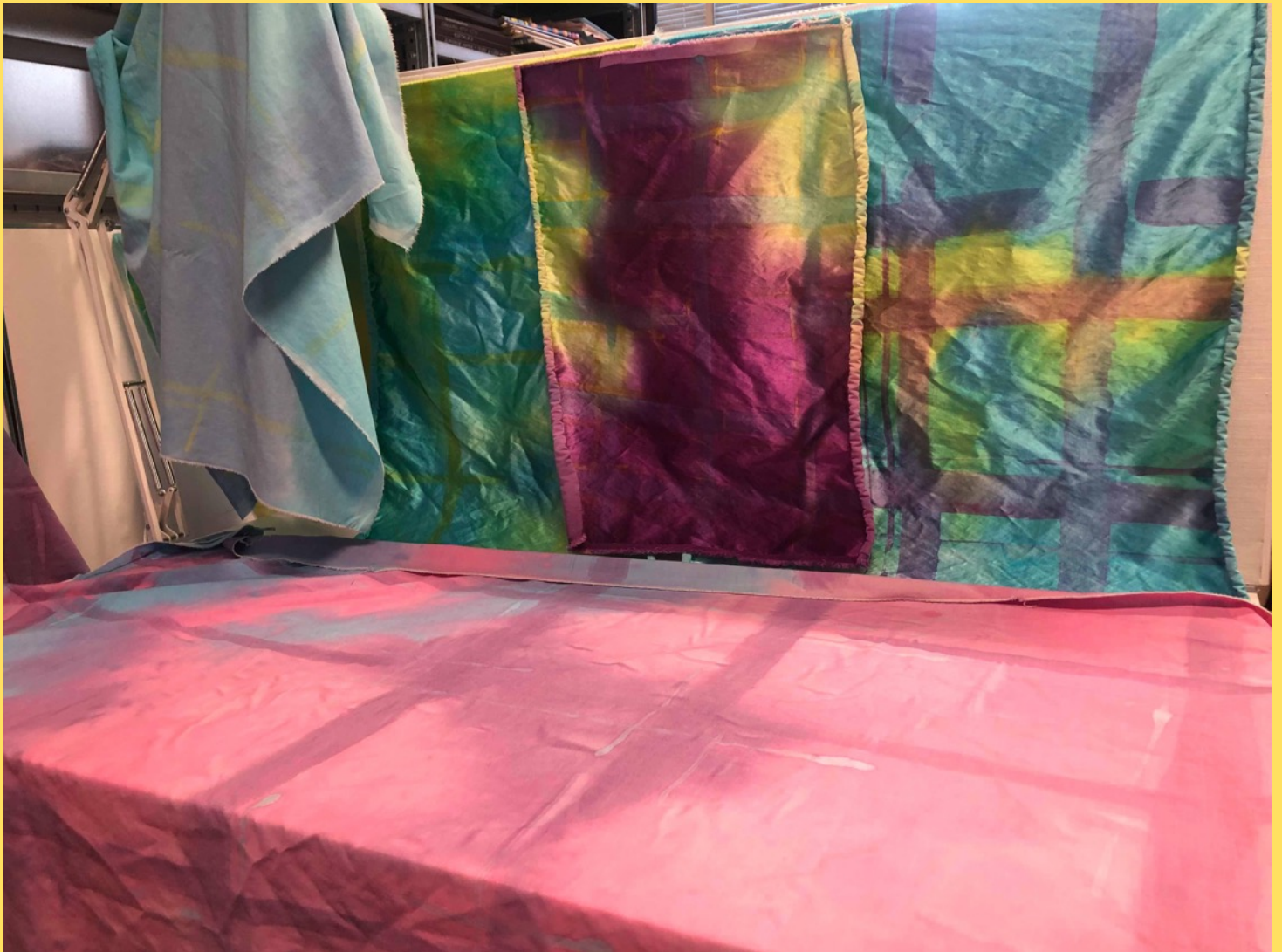
Handmålade tyger med det skeva rutmönstret. Bomull (gamla lakan) och viskos.