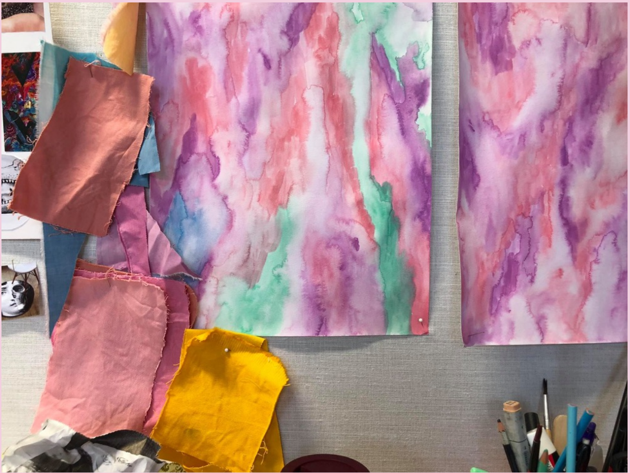
Handfärgade tygprover och akvareller som sedan blev ett fodertyg i en jacka.