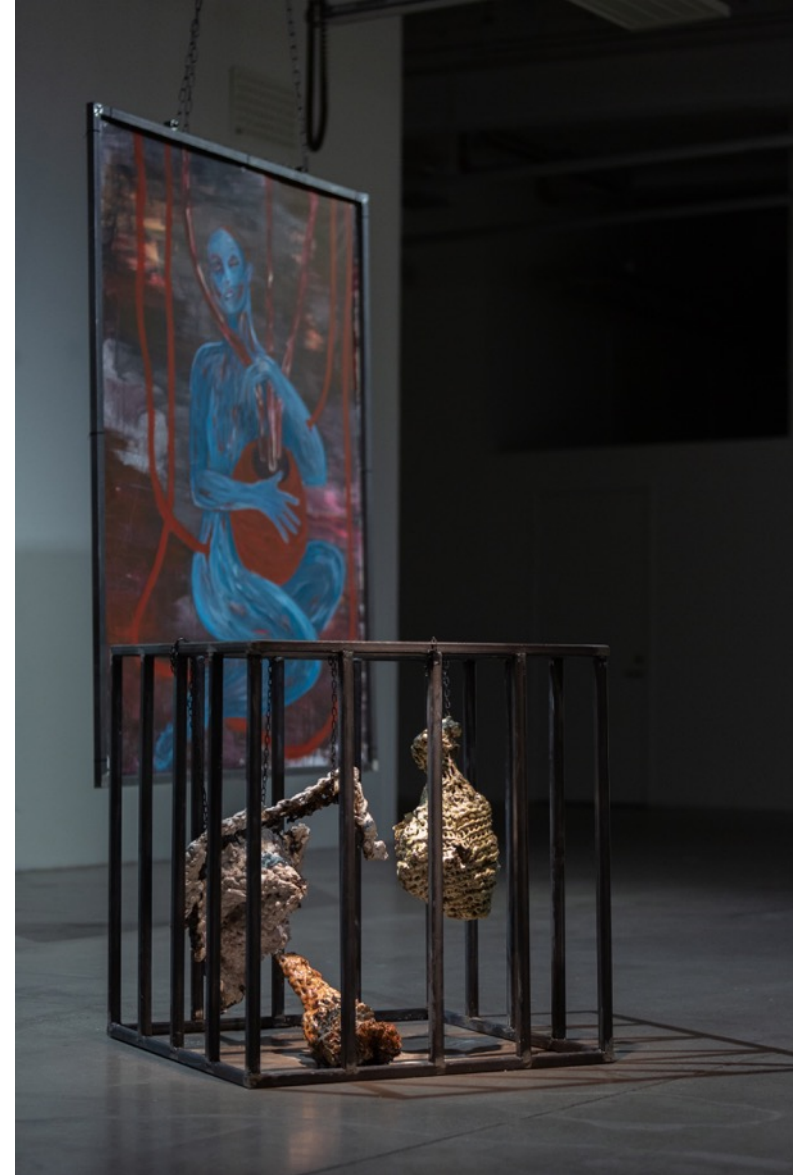
Att svälja världen. Installation, 2019. Skulpturerna i installationen är gjutna med hjälp av buren.