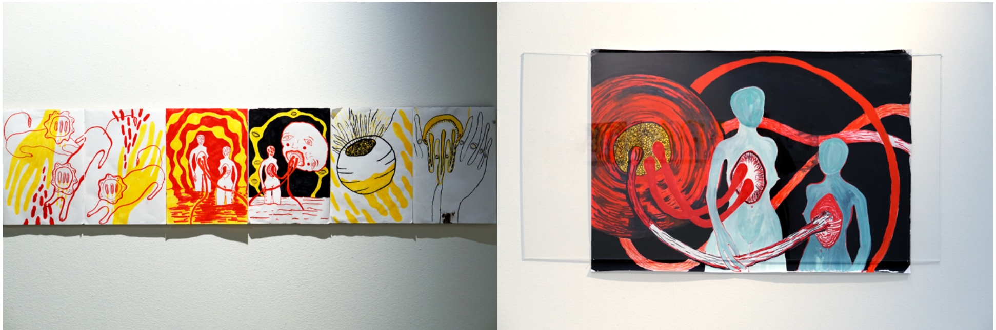
Teckningar och målning från installationen Det här rummet är inte för alltid 2019.

I mitt måleri blir figurerna blir mer och mer bekanta. Först var de ansiktslösa. Sen blev de till aliens och monster i dystopiska landskap. Från början var det små små teckningar i min anteckningsbok. Det blev till större teckningar och sen målningar.